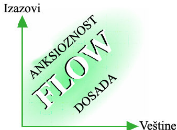
Grafik br.1. Uslovi za nastanak flow-a

2) Gubitak svesti o sebi - u situacijama kada su izazovi veliki za pojedinca i kada su važne njegove veštine da bi se suočio sa njima, njegova se pažnja potpuno usmerava na datu aktivnost. To rezultira time što se ljudi toliko usmere na ono što rade da im aktivnost postane spontana. Prestaju da budu svesni sebe. Ovo je ujedno i jedna od najkarakterističnijih osobina optimalnog iskustva. Zbog toga se optimalno iskustvo naziva još i očaravajuća obuzetost.